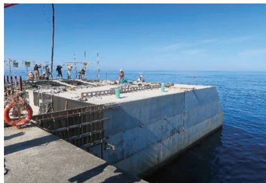
浜田港福井地区防波堤(新北)整備事業(西堤) (国土交通省中国地方整備局 境港湾・空港整備事務所)

このような状況に対応し、年間を通じて安全で利用しやすい港となるように、国の港湾整備事業にて防波堤(新北)の整備が進められています。令和2年度は、西堤の一部が整備されました。この他にも新たな上屋や臨港道路の整備など、利便性の向上が図られています。