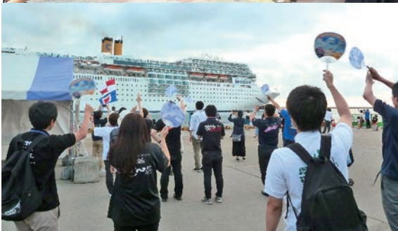
クルーズ船の寄港に伴う歓迎風景 (写真は過年度のものです)