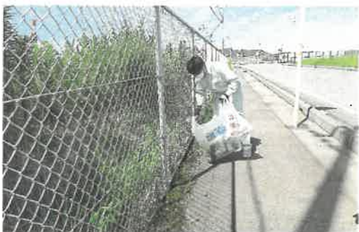
浜田港湾振興センター及び浜田港振興会のスタッフによる清掃活動活動

浜田港清港会は、浜田港に関わる自治会、企業及び行政等を会員として、浜田港区域内の環境整備の促進を目的として活動しています。