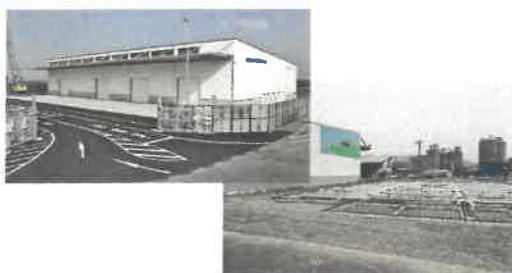
福井上屋(同規模予定:2,000㎡)

浜田港のコンテナ貨物取扱量は、平成29年度から令和2年度まで4年連続で過去最高を更新しています。このコンテナ貨物の増加に対応するため、更なる港湾施設の拡充が期待されています。このような中で、令和3年10月にコンテナ貨物の荷捌きをする施設として、「浜田港福井第2上屋建設（建築）工事」が始まりました。令和4年度の完成を目指し工事が進んでいます。