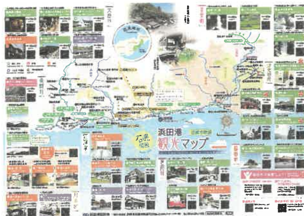
浜田港観光マップ(ふ頭からの所要時間マップ)