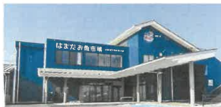
はまだお魚市場(山陰浜田港公設市場)

グランドオープンにあわせて、はまだお魚市場（山陰浜田港公設市場）は、「みなとオアシス浜田」の代表施設として登録されました。地元市民の憩いの場として、また県内・県外からの観光客の訪問先として、今後の更なる集客を見込んでいます。