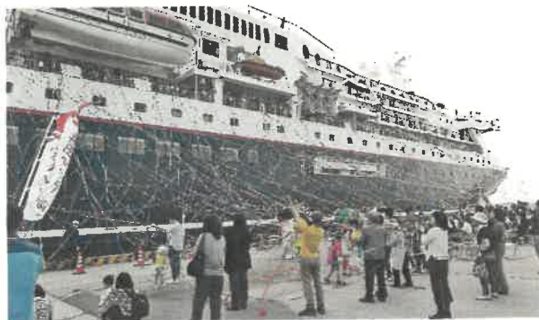
クルーズ船の寄港に伴う歓迎風景(写真は過年度のもの)

令和3年度のクルーズ客船は、日本船籍「飛鳥Ⅱ」の寄港が7月25日に予定されておりましたが、残念ながら、令和2年度に引き続き、新型コロナウイルス感染症の影響により寄港が中止となりました。